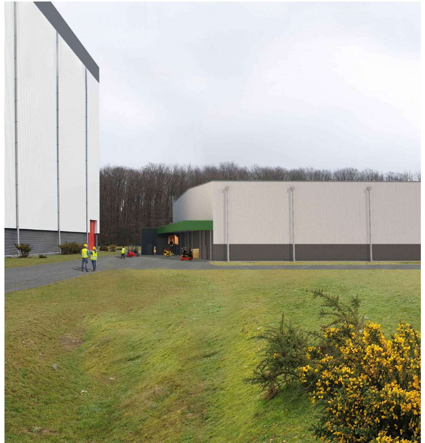
CONSTRUCTION D'UN BÂTIMENT GARDE MEUBLE ZA Les Marchais _ 28480 Luigny