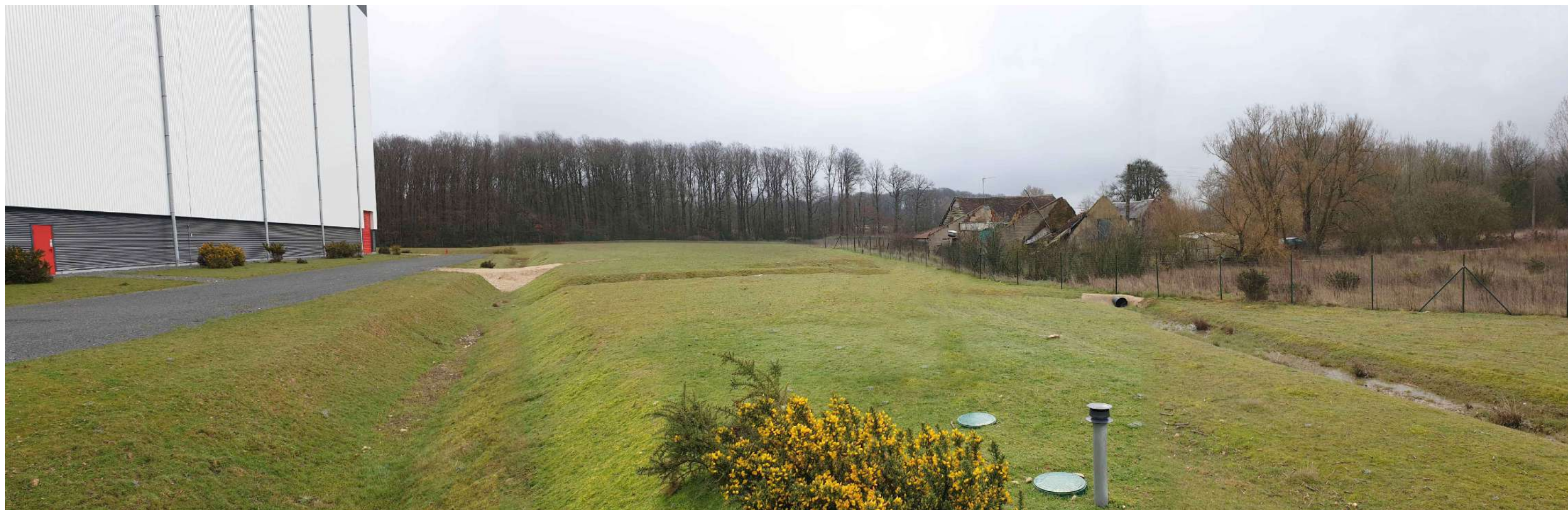
Photographie du site _ environnement proche VUE 2