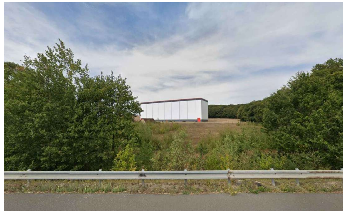
Photographie du site _ environnement lointain VUE 1